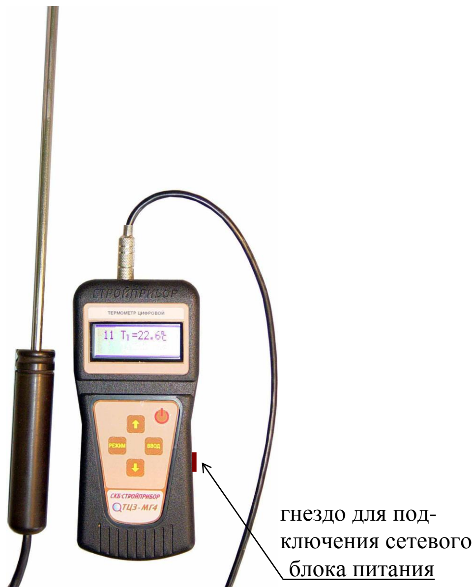
Рисунок 1 - Общий вид термометра

1.3.2 Термометры поставляются заказчику в потребительской таре.