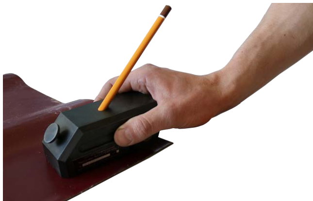
Рисунок 2.2 – Проведение испытания