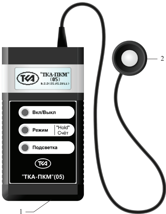
Рис.1 – Внешний вид прибора “TKA-ПКМ”(05) 1 – Блок обработки информации 2 – Измерительная головка