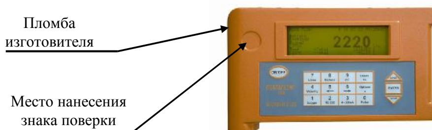
Рисунок 6 - Схема пломбирования расходомеров Portaflow 300