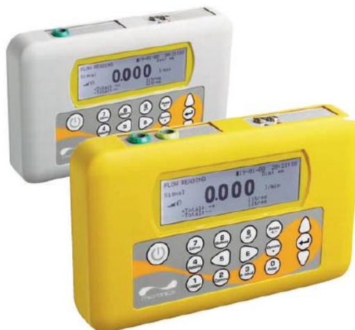
Рисунок 2 - Общий вид расходомеров Portaflow 220, 330