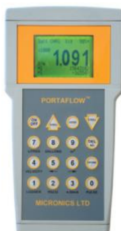
Рисунок 1 - Общий вид расходомеров Portaflow 204, 216, SE

На рисунках 1,2,3 представлен общий вид расходомеров.