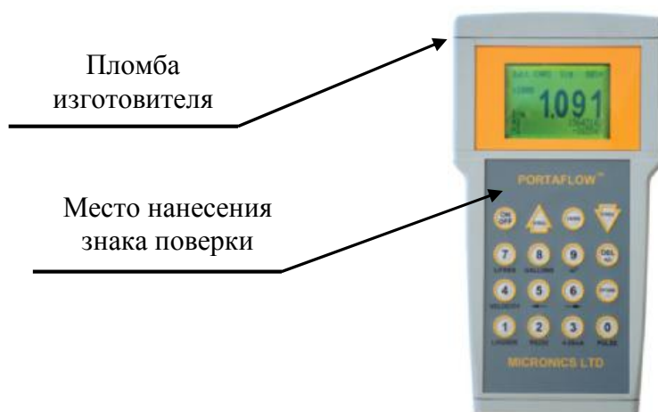
Рисунок 4 - Схема пломбирования расходомеров Portaflow 204, 216, SE

На рисунках 4,5,6 приведена схема пломбирования для ограничения доступа к узлам регулировки и элементам конструкции расходомеров.