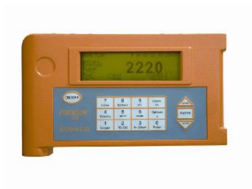
Рисунок 3 - Общий вид расходомеров Portaflow 300

На рисунках 4,5,6 приведена схема пломбирования для ограничения доступа к узлам регулировки и элементам конструкции расходомеров.