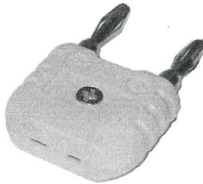
Рисунок 2 – Адаптер TC-to-banana